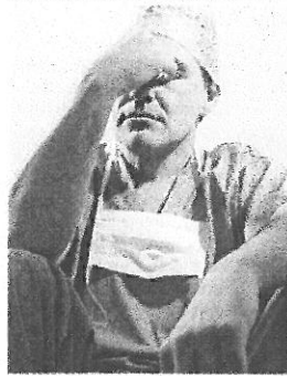
2014. gadā biežāk saņemtie iesniegumi par veselības aprūpes kvalitāti pa medicīnas specialitātēm. Kopā saņemti 1049 iesniegumi, no tiem pamatotas sūdzības – 204