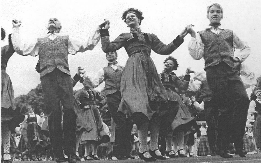
Līdz varavīksnei tikt Daugavas stadionā grib liels un mazs.