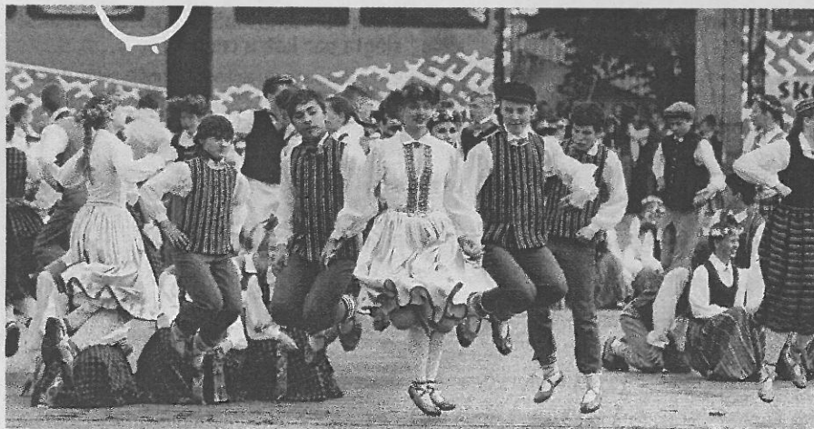
No autobusa Daugavas stadiona fonā izbirst mazie dejotāji, kas piedalās mazās meitenītes Artas braucienā uz varavīksni.

— Vai ierēdņi daudz var iebilst pretim, ja ģenerālais politiskais uzstādījums ir mazināt, nodot prom lielas funkcijas? — Tā bija metodoloģija — griezt, nedomājot par sekām. Iesaistījis lobiju, lai, aizbildinoties ar birokrātisku slogu, saruktu kontrole būvobjektos, taču lielākā mērā te bijusi darišana ar politisko infantilismu, neapdomību. Tā saucamie sociālie partneri krīzes periodā arī skubināja nogriezt lieko, atdot privātajiem, un tā var izlaist no valsts rokām jebko! Bet ir būtiskas lietas, kur valstij pašai jāatbild, un celtniecības uzraudzība ir viena no tām. Ļoti žēl, ka sapratne par to samaksāta ar cilvēku bojāeju. Pašreiz Zolitūdes izmeklēšanas komisija apkopo secinājumus, liecības, speciālistu vērtējumus, un rudenī nolasīs gala ziņojumu. Mans secinājums: par nelaimi atbildības tiesa jāuzņemas arī Saeimai, valdībai, Ekonomikas ministrijai un Rīgas domei — varasvirkiem, kuri darbojās attiecīgajā periodā. Konkrētiem atbildīgajiem ir jāsniedz reāls cietumsods.