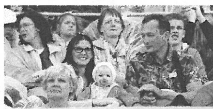
Atmosfera deju lieluzvedumā ir neaizmirstami savijījoša.