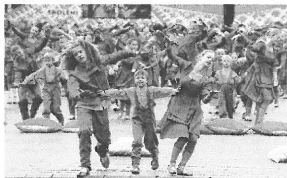
Deju lieluzvedumā savijas tautiskie un laikmetīgie motīvi.